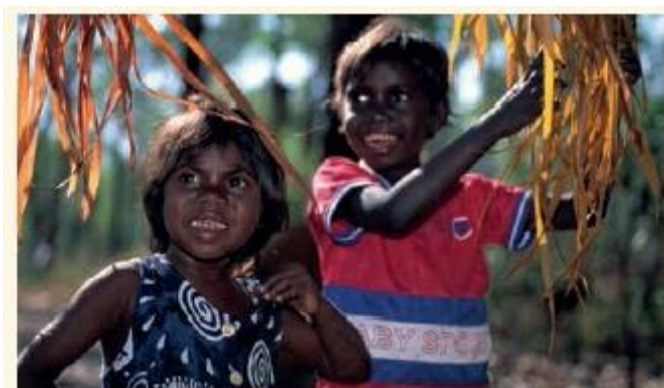
Rdzenni mieszkańcy Australii – Aborygeni.

A nad oceanem było wielu surferów. Surfing to tutaj bardzo popularny sport. W Sydney jest aż siedemdziesiąt plaż.