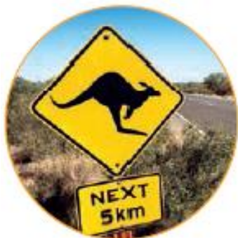
Y Znak drogowy ostrzegający przed kangurami.

Często jeździliśmy na wycieczki. Wszystko jest tu takie inne! Na przykład samochodem jeździ się po lewej stronie, więc trzeba bardzo uważać, gdy przechodzi się przez ulicę.